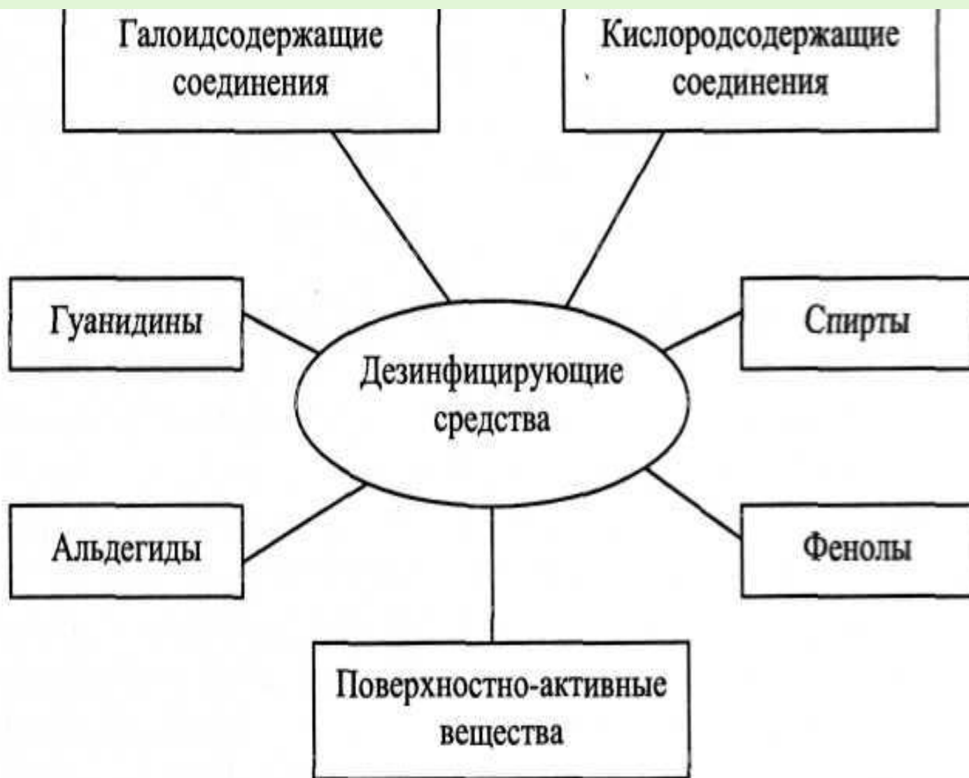
Рис. 2. Классификация дезинфицирующих средств