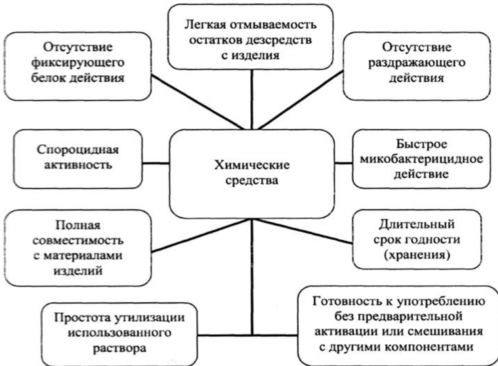
Рис. 4. Требования к химическим средствам, применяемым для обеззараживания ИМН